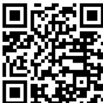
Biuro Karier na Instagramie