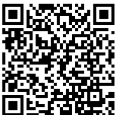
Biuro Karier na Facebooku

Co piątek na Facebooku pojawia się zestawienie wybranych ofert pracy, praktyk i staży z serwisu biurokarier.edu.pl (więcej na stronie 8).